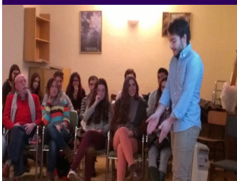
Presentación del voluntariado en Perú

Primer domingo de mes: los locales de la parroquia comienzan a llenarse de vida a eso de las 18.30. La sala parroquial o sala Madeleine es el lugar de encuentro para que uno de los grupos de jóvenes de Santa María cuenten una experiencia significativa que las hecho crecer y que ofrecen a los demás. La primera fue: "qué me traje del verano", la segunda, la experiencia de peregrinar juntos a Taizé, y la última el