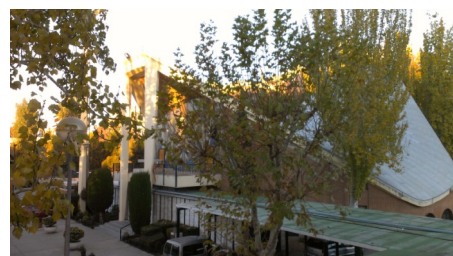
Amanece sobre nuestra casa, Santa María del Pilar.

Nos hemos dado cuenta de que Santa María, uniendo su plataforma educativa y evangelizadora, colegio y parroquia tiene una potencialidad increíble para ir haciendo realidad este sueño que está en nuestro mismo carisma. Nos hemos puesto manos a la obra para elaborar entre todos un único Proyecto Pastoral para este lugar de Iglesia y de Familia Marianista. Y nos estamos creyendo que verdaderamente JUNTOS SOMOS MÁS. Estoy convencido de que el Espíritu de Dios nos está acompañando porque en nuestra comunidad se respira alegría, ganas, ilusión. Porque surgen nuevas iniciativas, porque nacen pequeñas comunidades y porque se siente calor de hogar. En este tiempo de adviento a las puertas de la navidad, quiero daros las gracias a todos los que ponéis alma, corazón y vida en cuidar de nuestra casa. ¡Qué María nos ayude a mantener y acrecentar el espíritu de familia!