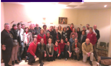
Grupo de Sínodo Elaborando el Pro- yecto Pastoral de Santa María

Posiblemente esta frase del profeta Isaías recoja bien lo que estoy sintiendo ahora mismo, con respecto a la pastoral del colegio Sta. María del Pilar y a la parroquia. Cuando tenemos algo nuevo entre manos, estamos ilusionados, nos sentimos vivos, cuando todo es rutina y todo es lo de siempre, poco a poco nos vamos apagando y nos encerramos en nosotros mismos. Por eso es un buen criterio sentir la novedad en nuestra práctica pastoral, y en la Iglesia, ¿no lo notáis?. Yo creo que entre todos estamos haciendo brotar algo