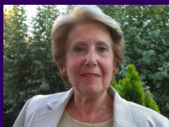
Coordinadora del Equipo de Pastoral de la Salud